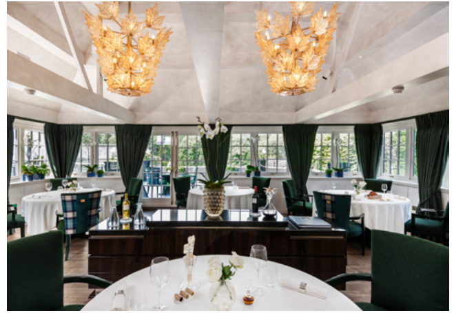
Restaurant The Glenturret Lalique Crieff, Ecosse