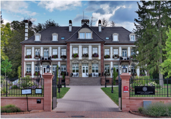
Château Hochberg by Lalique Wingen-sur-Moder, Alsace