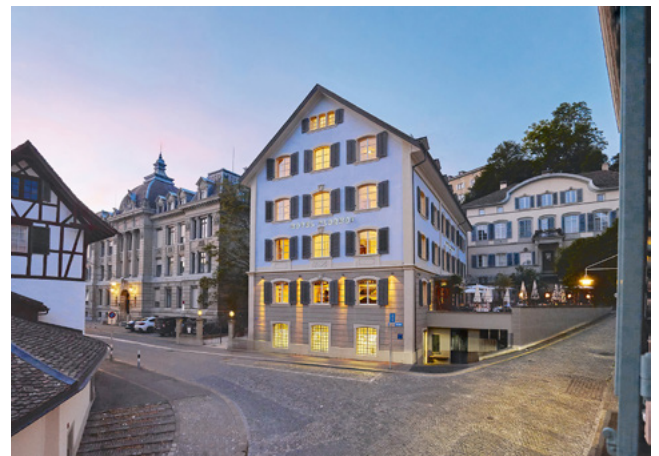
Villa Florhof Zurich, Suisse