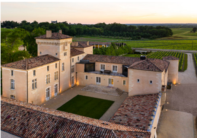
Château Lafaurie-Peyraguey Bommes, région de Bordeaux